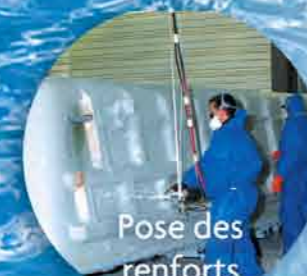
Pose des renforts