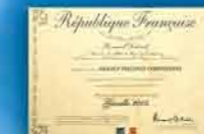
Prix GAZELLE 2005

1 rue Joseph Thoret - Z.I. Le Tubé Nord - 13800 ISTRES - Tél : 0 442 563 130 - Fax : 0 442 562 574 Site : www.francepiscinescomposites.fr